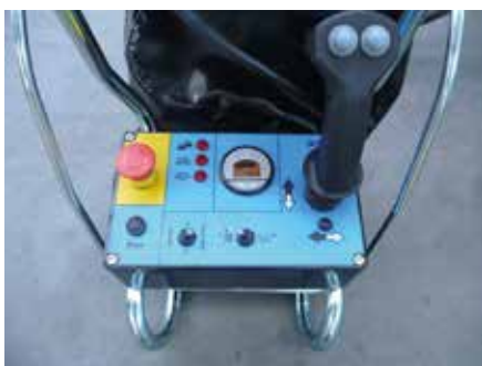
Quadro comandi sulla piattaforma semplice e intuitivo