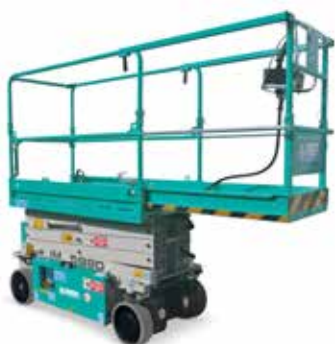
Estensione manuale piattaforma 1 m