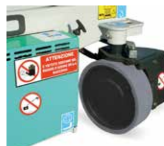
Sterzo idraulico a 90°